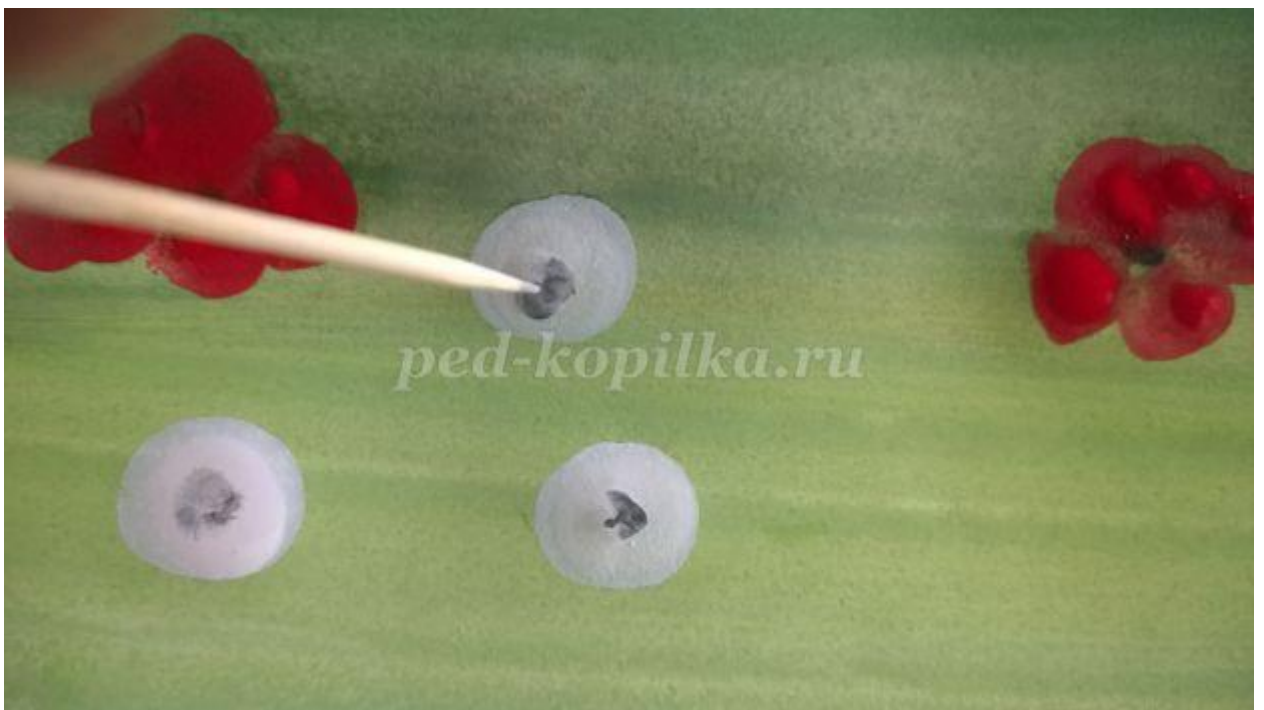
11. Рисуем маки кончиком кисти на дальнем плане поля. Тонкой кистью рисуем стебельки, листочки.