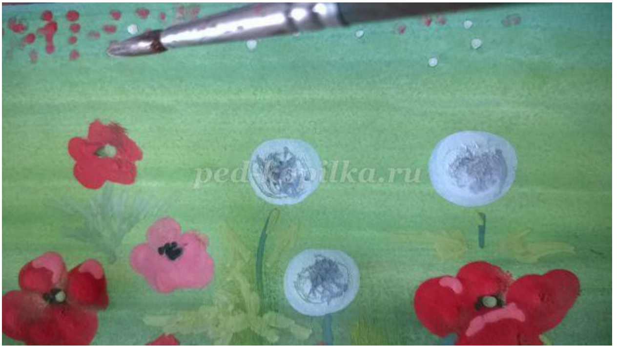
12. Щетинной кистью легкими движениями рисуем травку.